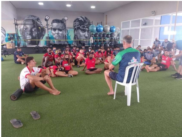
Kép 6: A Covid-19 se állított meg minket. Taktikai megbeszélés a fiatalokkal.

Jelenleg több mint háromezer játékos van a Bauru vízilabda szakosztálynak. Az utolsó bajnoki döntőt 16:5 re nyertük. A folytatás már nélkülem... hazafelé készülök.