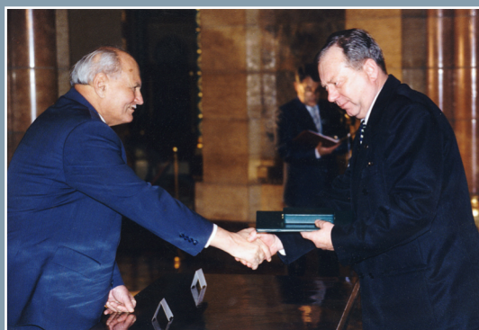
A Köztársasági Érdemrend Tisztikeresztjét veszi át (1998)