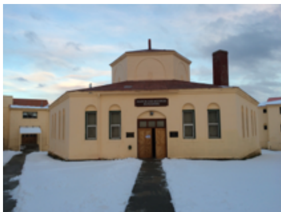
Különleges előadáshelyszín: a volt börtön péksége

A szakmai előadásokat hotelekben és egyéb különleges helyszíneken szervezték meg