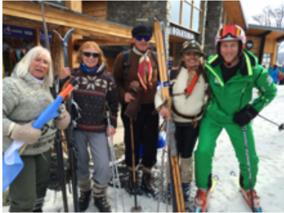
A helyi retro csapattal

meg tudtuk beszélni a tapasztalatainkat. Portilloban például a helyi síiskola vezetője az USA demo tagja volt és nagyon szívesen alkalmazna magyar oktatókat a csapatában.