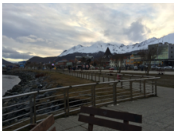
Városkép a kikötőből