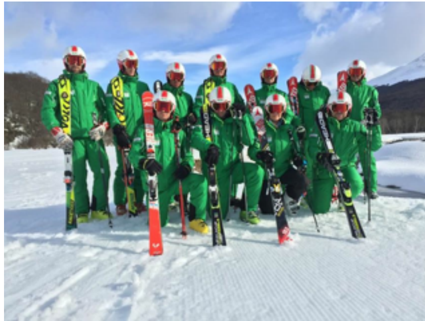
A magyar Interski csapat

A csapatunk az érkezést követő másnap elkezdte a felkészülést és magunkat nem túlhajszolva sieltünk és gyakoroltunk közel négy napot. Hozzászoktunk az új felszereléshez, a körülményekhez, kihevertük a jet laget. A három formációnk működött, elégedettek voltunk a viszonylag rövid idő alatt elért eredménnyel. A kongresszus előtt már több csapat is megérkezett a helyszínre, de mi biztosan az elsők között voltunk, akik a bemutató előtt itt gyakoroltak.