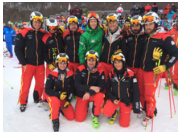
Haverkodás a német csapattal

Bár nem szakmai program volt, de vacsora után minden este volt buli különböző helyszínen és szervezésben. Itt a magyar delegáció szintén odatette magát, nem hiányoztunk egyikről sem.