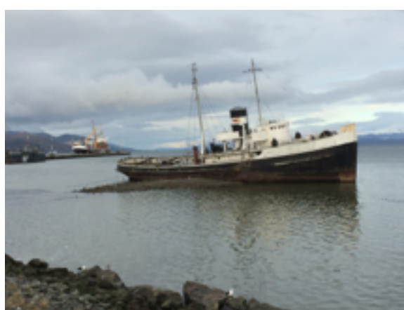
Hajóroncs a kikötőben: turistalátványosság

hivatalosan a rendezvénynek és a szállások is kizárólag itt voltak. Ez azt jelentette, hogy a