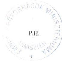
Balog Zoltán emberi erőforrások minisztere